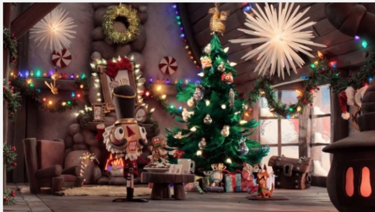
Fortnite: Season 7 ist da - neue Herausforderungen und Inhalte