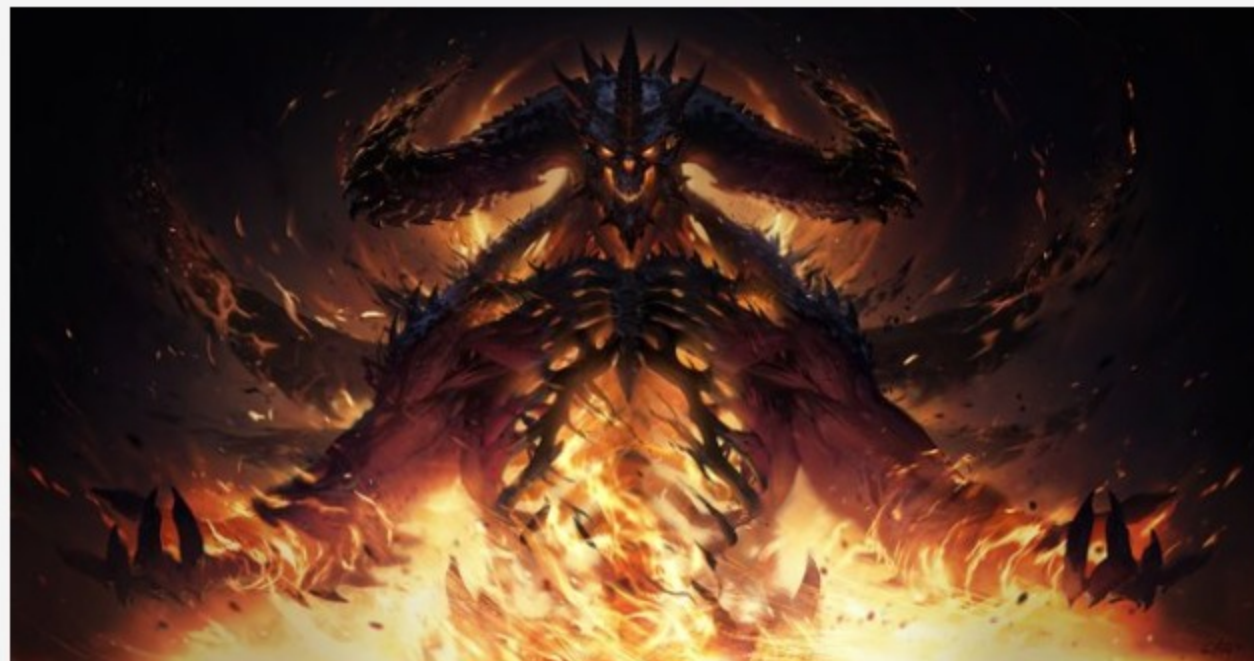
Diablo Immortal: Die Ankündigung ging gepflegt in die Hose.

Versteh' mich nicht falsch! Ich will den Leuten nicht ihre Unterhaltung verbieten. Kommen wir also zu meinem nächsten Wunsch: In den letzten Jahren haben Spieleentwickler immer wieder auf ungewöhnliches Marketing gesetzt. In Rust wurde die Länge des Gemächts per Zufall bestimmt. In Age Of Conan gab es dafür einen Schieberegler. In Red Dead Redemption 2 passen sich die Hoden der Hengste an das Wetter an. Ich wünsche mir für 2019 einen Entwickler, der den gleichen Publicity-Stunt auch mit weiblichen Genitalien versucht. Der darauffolgende Aufschrei sollte eine unendliche Quelle köstlicher Unterhaltung für die ganze Familie auf Twitter, Facebook, Instagram und YouTube sein. Das wäre schön!